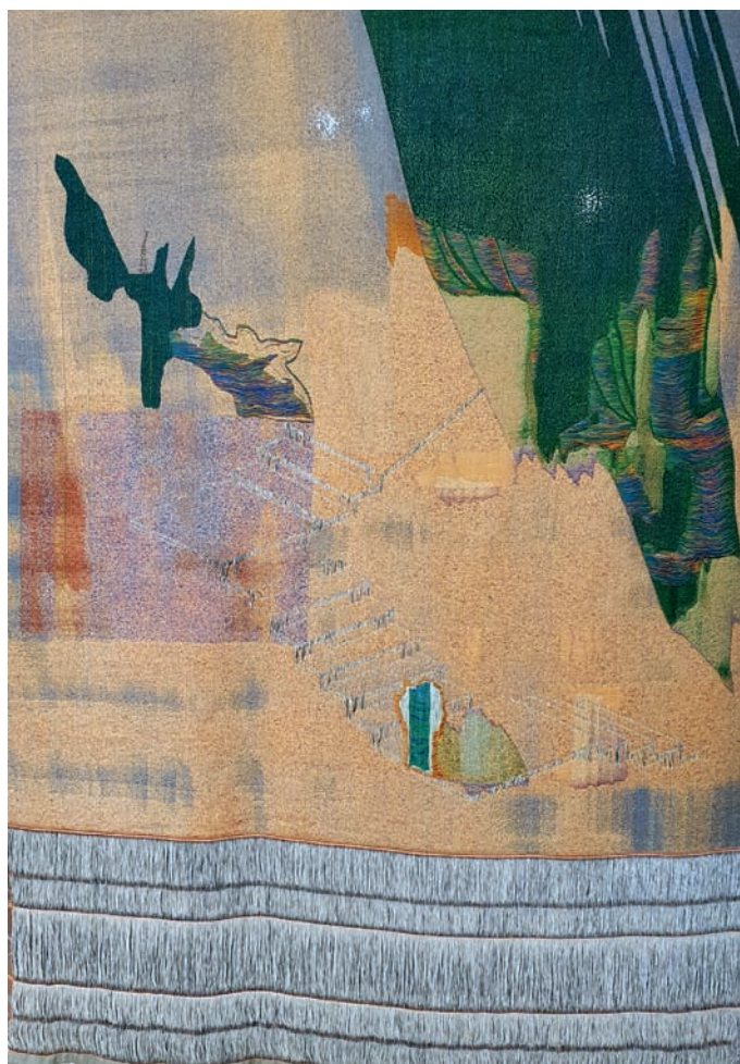
Laiptai (antra pusė). 2022 m. Skaitmeninis žakardinis audimas, vilna, 225 X 150 cm.