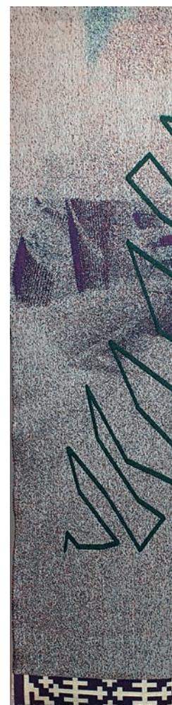
Žalia šviesa I, II, III. 2020 m. Skaitmeninis žakardinis audi ma