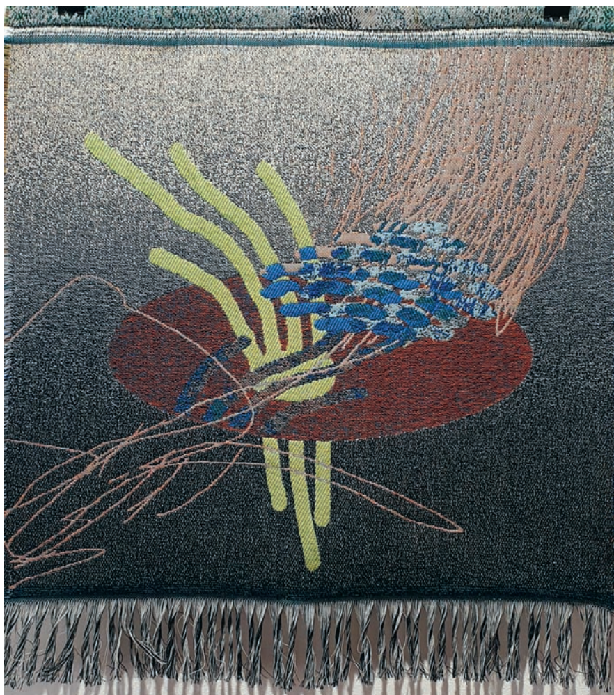
K. Austi. Raudonas apskritimas. 2023 m. Skaitmeninis žakardinis audimas, vilna, 77 X 90 cm.