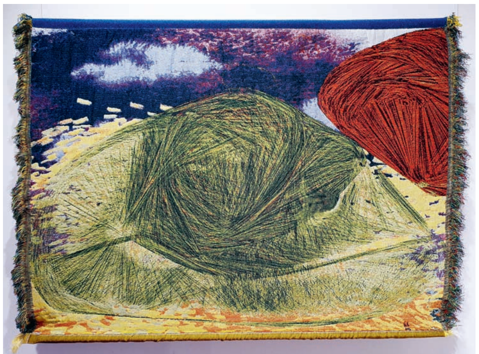
Du sūkuriai. 2020 m. Skaitmeninis žakardinis audimas, vilna, viskozė, linas, 167 X 122 cm.