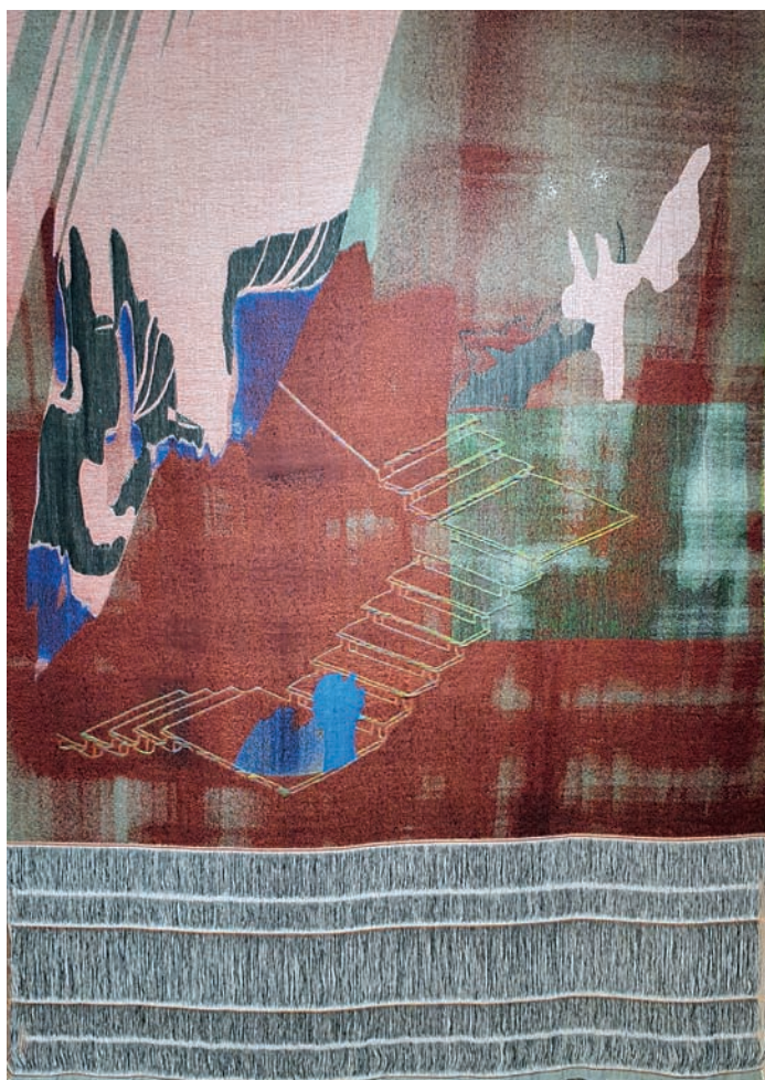
Laiptai. 2022 m. Skaitmeninis žakardinis audimas, vilna, 225 X 150 cm.