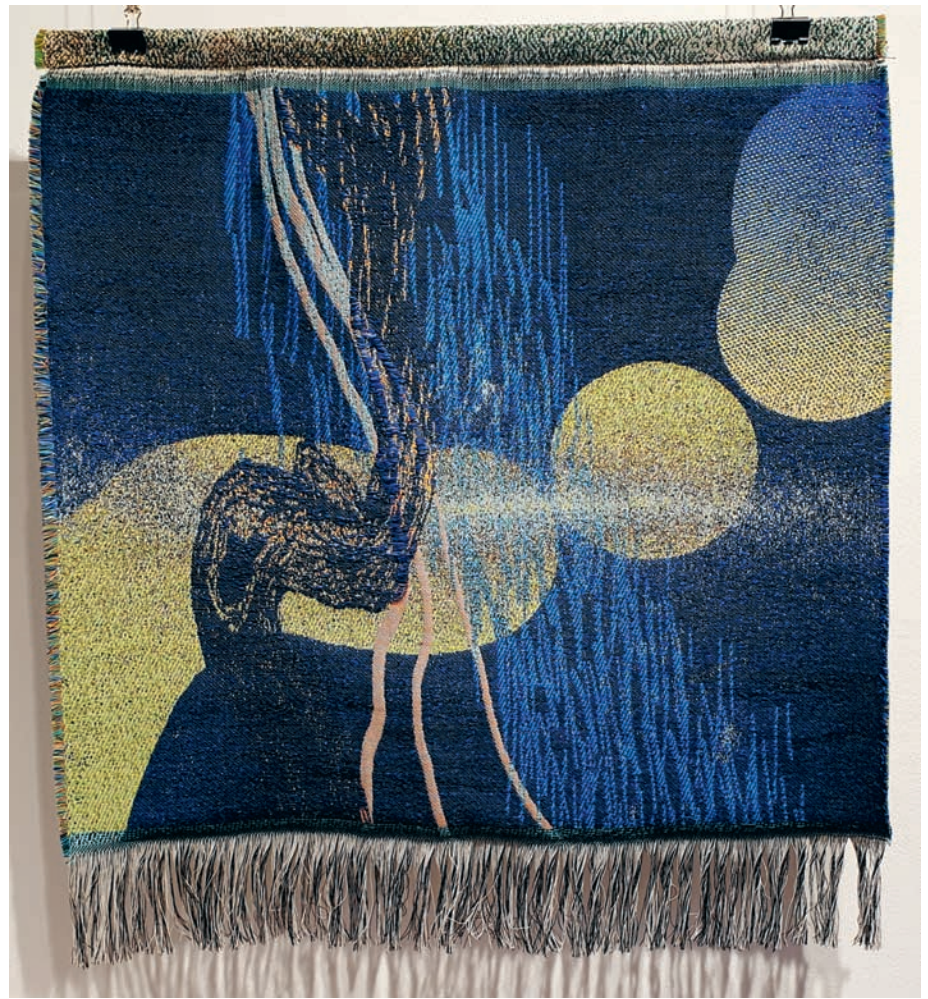
Geltonoji dėmė. 2023 m. Skaitmeninis žakardinis audimas, vilna, 77 X 90 cm.